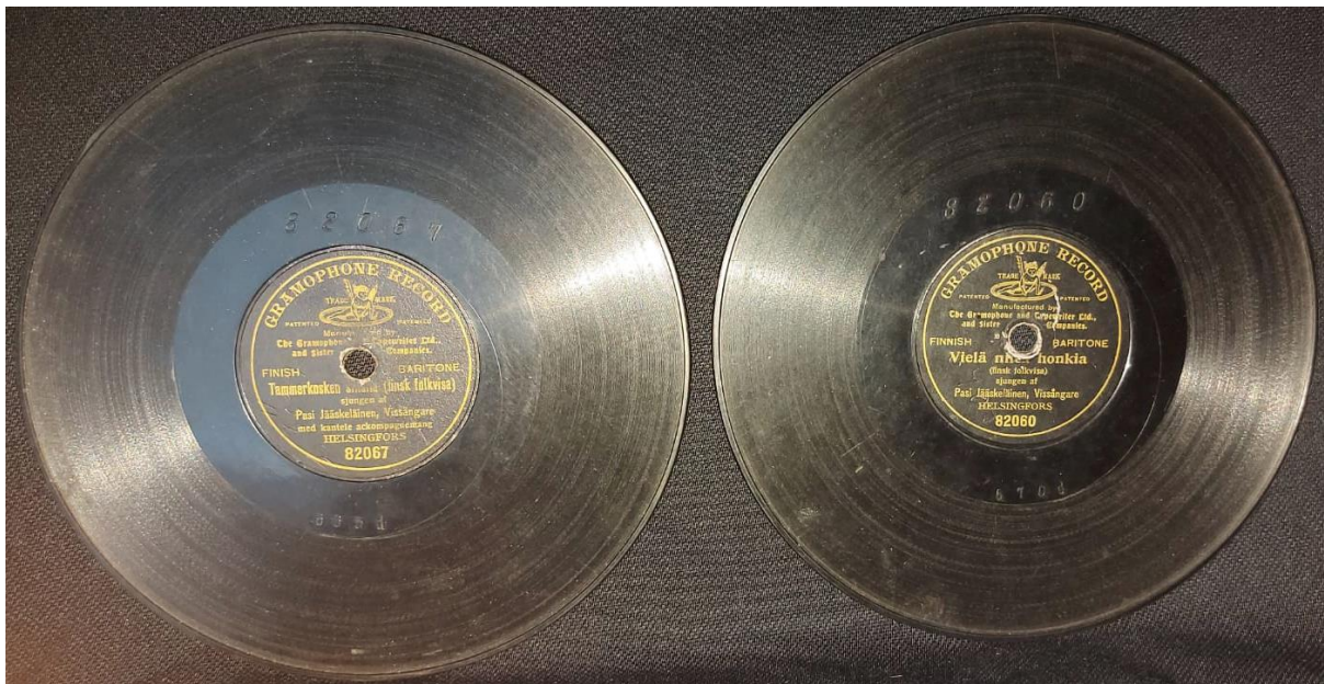
Tammerkosken sillalla (trad., kanteleen säestyksellä)

Tässä Musiikkiformaattimuseon omistamat, edellä mainitussa levytystapahtumassa äänitetyt kaksi levyä, yksipuolisia 7” savikiekkoja: